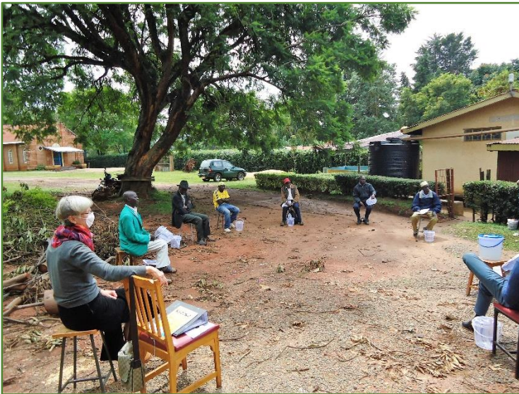
Vergaderen onder de Jacaranda boom naast het kantoor

Er is heel wat veranderd sinds de vorige Vriendenbrief van een half jaar geleden! De wereld staat inmiddels op z'n kop. In veel landen, wereldwijd, zijn grote delen van de maatschappij tot stilstand gekomen, terwijl andere delen kampen met ernstige overbelasting. Ook Kenia is niet gespaard gebleven voor het corona virus. Wat dat voor het KAP-team betekent, ziet u o.a. op de volgende foto's: