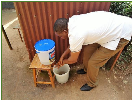
Handen wassen bij de poort, in water met Dettol