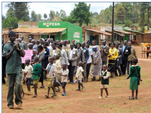
Processie in Saboti