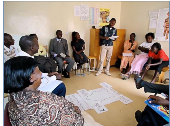
Vorbereiding buurtgesprekken over Vrede