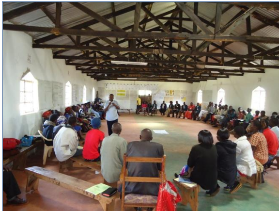
Workshop 'AIDS en veilig gedrag'

Uit een verslag van Father Fons Eppink MHM.