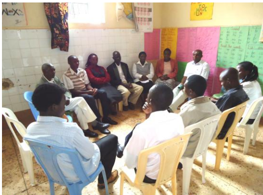
Ervaringen delen over de moeilijke gebeurtenissen ...

In de eerste helft kon men in verschillende groepen, onder leiding, zijn of haar hart luchten. In de tweede helft leerden we over het belang van de balans tussen gerechtigheid, waarheid, genade/vergeving en geweldloosheid voor het bereiken van vrede. Ook heeft één van onze theatergroepen spontaan in wijken waar de spanning erg hoog was, speciaal bedachte voorstellingen gegeven.