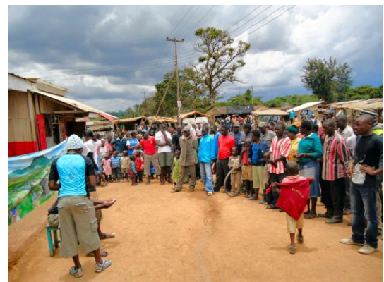
Vredestheater door jongerengroep in Kipsongo